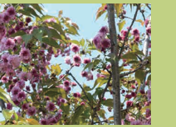
きたとしげ 真利家 (p15) あさくちんさとしちうちうえつな 浅口郡里庄町里見