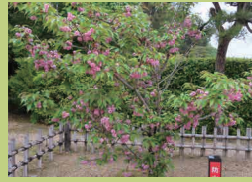
こうらくえん 後楽園 (p17) おかやま し きたく こうらくえん 岡山市北区後楽園 1-5 かくめいかんぜんてい 鶴鳴館前庭