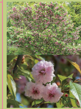
おかやまあき ひ こうとうがっこう 岡山朝日高等学校 (p18) ろっこう き ねんかん 六高記念館 (p18) おかやま し なかく ふるぎちうちう ちうめ 岡山市中区古京町 2 丁目 2-21