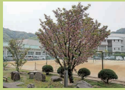
たかはしじょうなんこうとうがっこう 高梁城南高等学校 (p23) たかはし し ほんだきたちよう 高梁市原田北町 1216-1