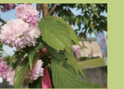
さとしろうちれきし みんぞくしりょうかん 里庄町歴史民俗資料館 (p14) あさくちんさとしちうちうえつな 浅口郡里庄町新庄 2405