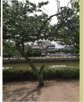
【場所】久松公園（鳥取県鳥取市東町2丁目） 米蔵広場の堀近く