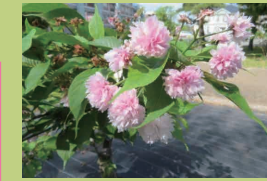
おかやまだいがく 岡山大学 (p19) おかやま し きたく つしまなか 1 3 3 岡山市北区津島中 1 丁目 1-1 ほんかこうざん 本部棟前