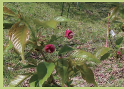
ざいもくいくしゆ 材木育種センター かんさいいくしゆじよう 関西育種場 (p21) かつたぐん な きのうちうちうえつな 勝田郡勝央町種月中 1043