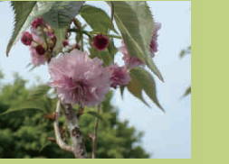
さとうきはあきせい か 佐藤清明生家 (p12-13) あさくちんさとしちうちうえつな 浅口郡里庄町里見