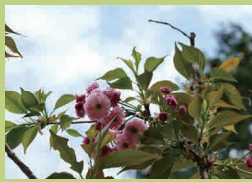
たかおかじんじや 高岡神社 (p16) あさくちんさとしちうちうえつな 浅口郡里庄町里見 5781