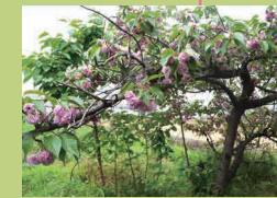
はらだけ 原田家 (p20) くらしき し みずしま 倉敷市水島