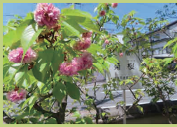
たかはしちゆうこうえん 高梁中央公園 (p23) たかはし し かのまのまち 高梁市柿木町 8-3

さとしろうちれきし みんぞくしりょうかん たかおかじんじや おかやまだいがく さんとくえん こうらくえんまえ てい もりこうえん たかはしちゆうこう 里庄町歴史民俗資料館、高岡神社、岡山大学、三徳園、後楽園前バス停そば、たけべの森公園、高梁中央公 園では、実際に近くで見ることができます。後楽園は通常鶴鳴館前庭には入れず、関西育種場は事前届が必要 です。それ以外に関しては学校・個人宅・施設の関係上、敷地内には入れません。