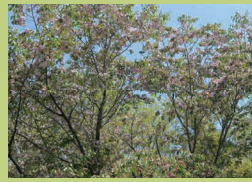
あさのけ 浅野家 (p22) かつたぐん な きのうちうちうえつな 勝田郡奈義町上町川