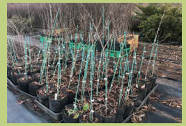
じゆもくい さいばいじよ 樹木医の栽培場所 (p11) めくく め なんばうしおのうち 久米郡久米南町塩之内