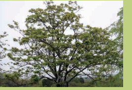
もりこうえん たけべの森公園 (p21) おかやま し きたく たけべちうたしこ 岡山市北区建部町田地子 1571-40